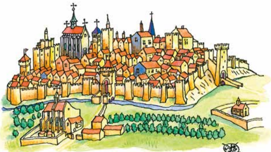
LA VILLE DE MONTFERRAND EN 1450 d'après de BÉTEL